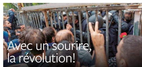
Avec un sourire, la révolution!