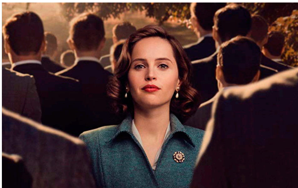
ON THE BASIS OF SEX