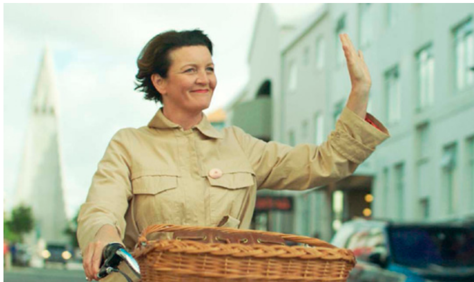
LA MUJER DE LA MONTAÑA

Visualment sorprenent i memorablement íntima. Una profunda i emocionant lliçó de vida. Perfecte equilibri entre la sensibilitat vers la humanitat i l'espectacle de la natura que l'envolta.