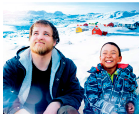
UNE ANNÉE POLAIRE