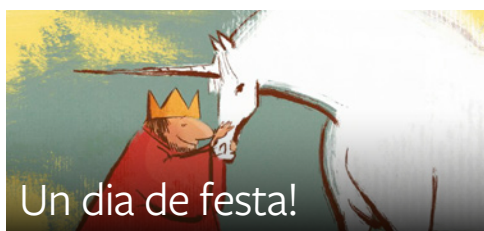
Un dia de festa!