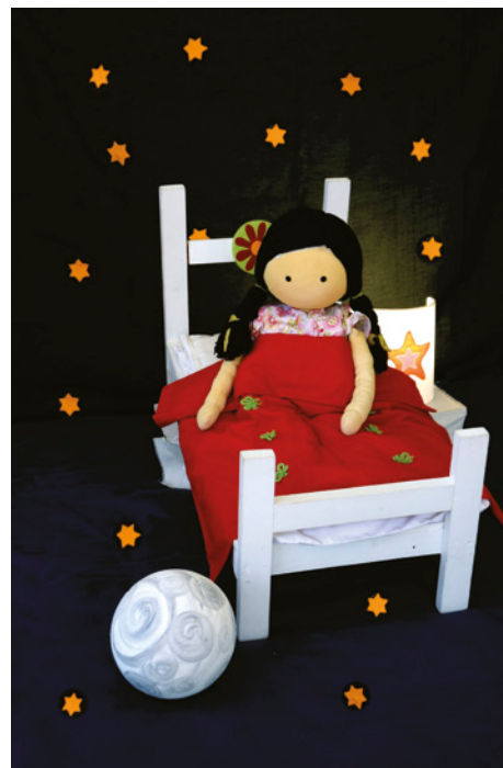
BONA NIT I TAPAT

GRATISME: AMADOR GARBELL / IMPRESSIÓ: IGBÀFC