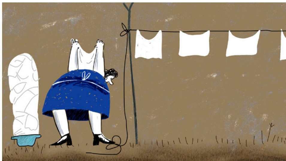
ONE, TWO, THREE

Pur cinema, un film emotiu, sorollós i viu que és un testimoni social i a la vegada poesia visual. Premiat a San Sebastian i als Gaudí.