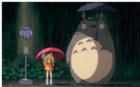
EL MEU VEÍ TOTORO

Producció noruega dirigida per Julia Dahr, amb música de Christopher White i fotografia de Julie Lunde Lillesæter. Durada 87 minuts. Documental. Un documental sobre la lluita per la justícia climàtica. En col·laboració amb Granollers en Transició.