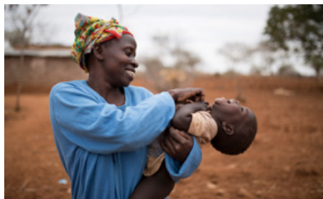
THANK YOU FOR THE RAIN

Producció espanyola escrita per Orson Welles (basada amb textos de William Shakespeare; llibre de Raphael Holinshed), amb fotografia d'Edmond Richard, música