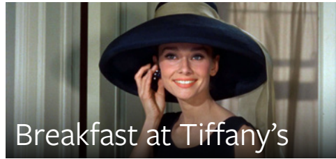
Breakfast at Tiffany's