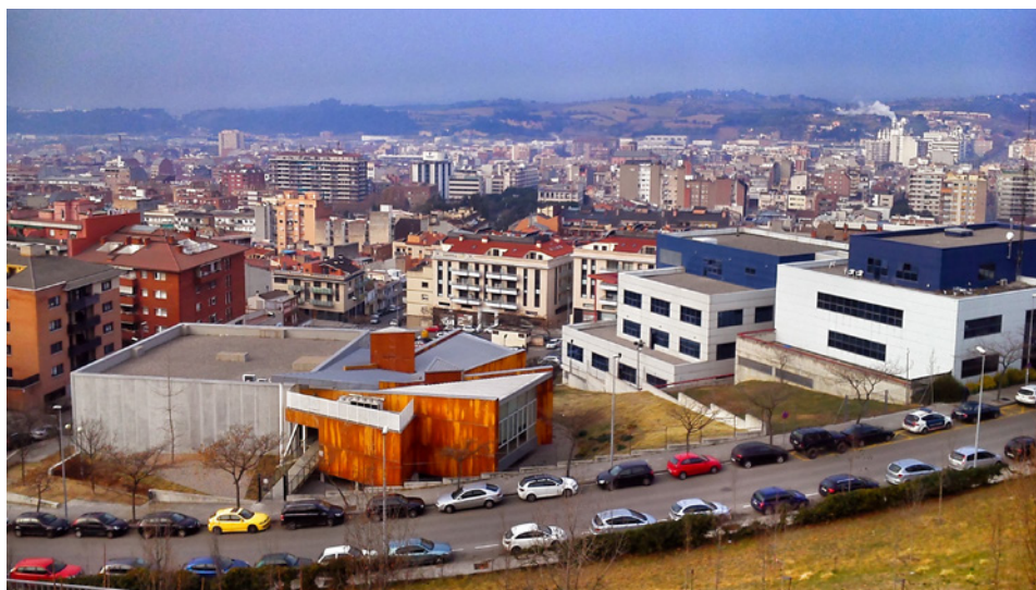
VISTA DE GRANOLLERS

A càrrec de Fulvio Amato (Institut IDAEA, Consell Superior d'Investigacions Científiques)