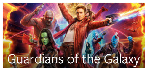
Guardians of the Galaxy