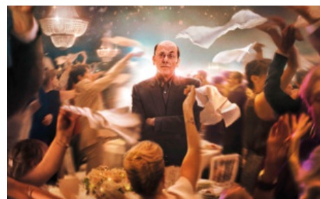
CEST LA VIE

El cantó més fosc de Washington queda al descobert en aquest thriller apassionat i fascinant.