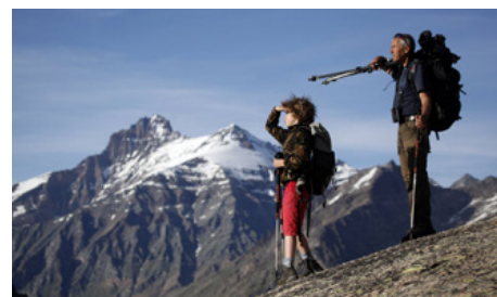
DESSINE-MOI UN CHAMOIS