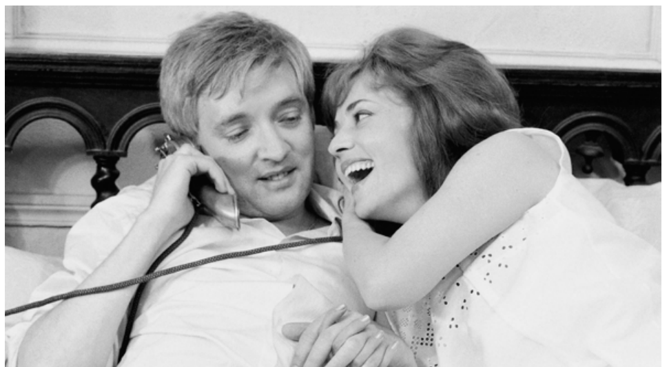
JULES ET JIM

Un dels millors Truffaut i per tant una de les millors pel·lícules de tota la història del cinema. Un film emblemàtic i un càlid homenatge a Jeanne Moreau.