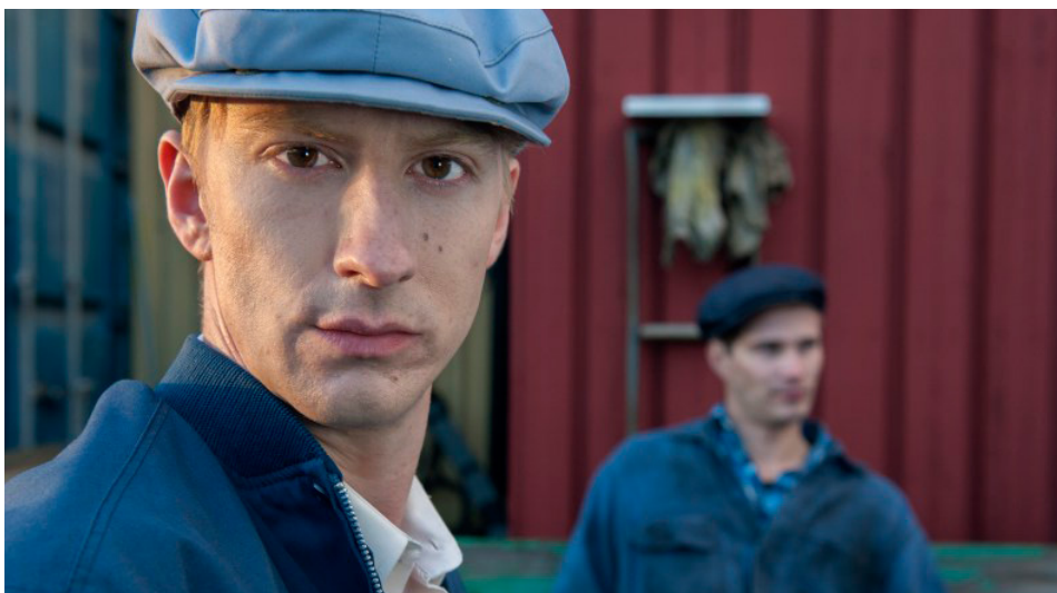
UN HOMBRE LLAMADO OVE