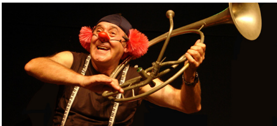
VIATGES DE PAPER