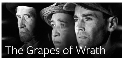
The Grapes of Wrath