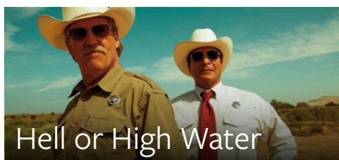
Hell or High Water