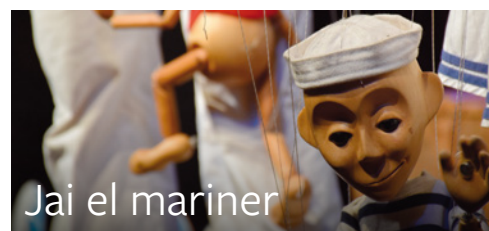
Jai el mariner