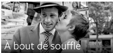
À bout de souffle