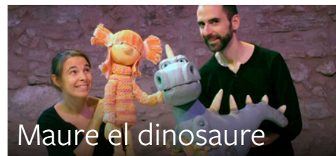
Maure el dinosaure