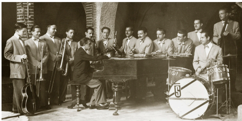
ORQUESTRA SELECCIÓ, ca. 1946

Concert organitzat per l'Ajuntament de Granollers, la Comissió del Centenari Garrell, Jazz Granollers, Casino de Granollers–Club de Ritme i l'Associació Cultural de Granollers, dins del 45è Cicle de Jazz al Casino.